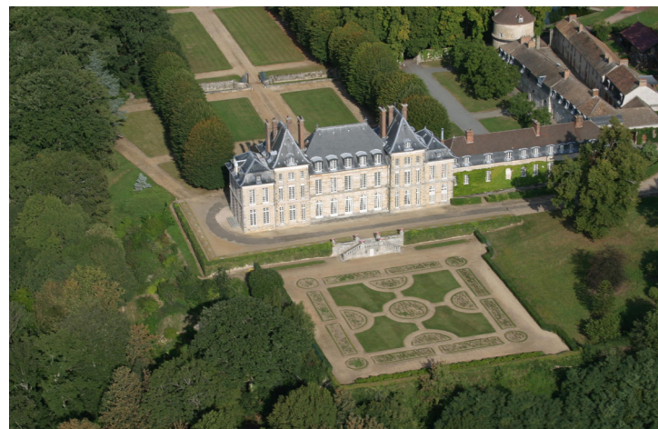
Le château de Saint-Jean-de-Beauregard