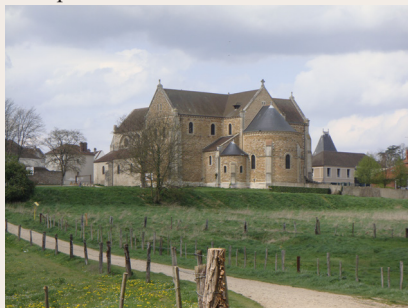
La basilique de Longpont

France, après celui de Saint-Sernin de Toulouse. Ce reliquaire très ancien est riche de plus de 1 500 reliques dont un morceau du voile de la Vierge. Il est à l'origine de nombreux pèlerinages depuis le Moyen Âge. Celui du 15 août attire chaque année un grand nombre de fidèles. Longpont est également une étape sur un des chemins de Saint-Jacques-de-Compostelle.