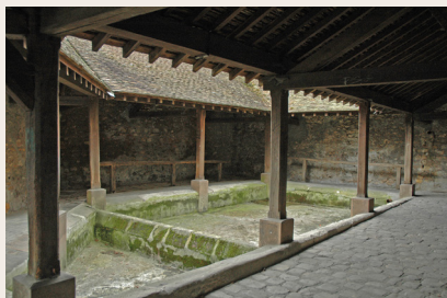
Le lavoir de Longpont