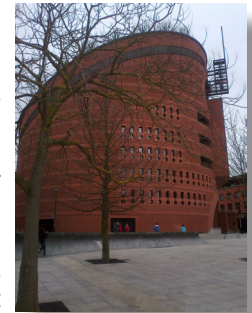
La cathédrale d'Evry

6 Franchir le passage à niveau à gauche, et tourner à droite pour gagner la gare de Ballancourt. 7