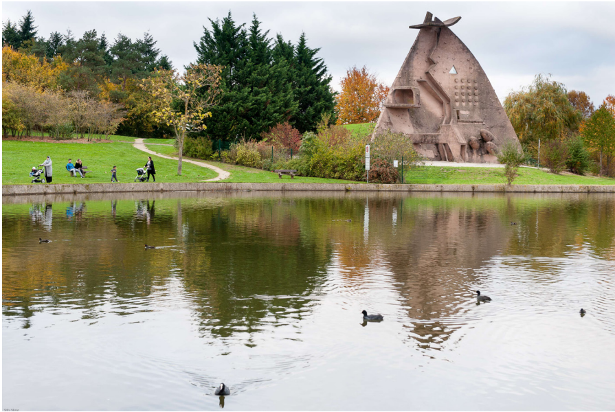
La dame du Lac